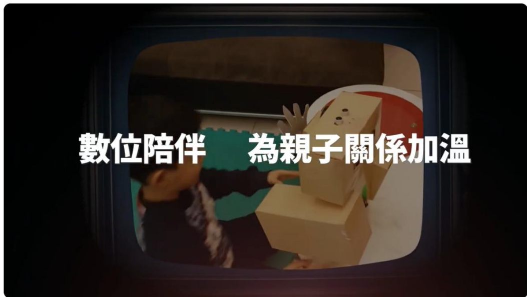
秀山國小114-2家長日校務重點說明