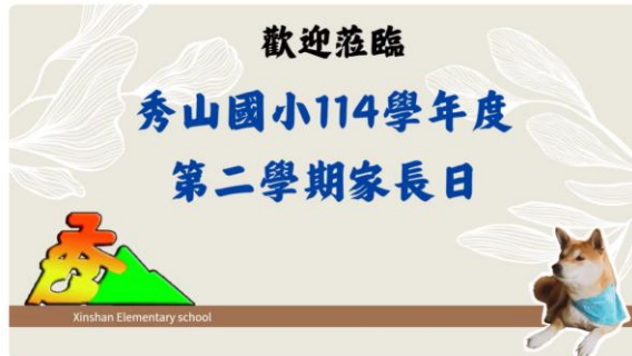
秀山國小114-2家長日校務重點說明